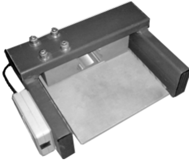
Рисунок 1. Внешний вид датчика

Это позволяет существенно упростить установку датчиков под ножки медицинской кровати, при этом, практически не изменив её высоту. Датчики обладают высокой разрешающей способностью в сравнении с зарубежными аналогами и большим диапазоном допустимой нагрузки. Всё это в совокупности позволило поставить задачу разработки такого комплекса, который позволил бы без непосредственного подключения датчиков к пациенту производить мониторинг физиологических характеристик: дыхание и пульс у спокойно лежащего человека и обнаруживать двигательную активность в случае ее возникновения, что особенно важно при мониторинге состояния людей в коматозном состоянии. В последние годы в клиниках всё чаще практикуется введение пациентов в состояние искусственной комы для предотвращения шокового состояния при тяжелых травмах, что повышает актуальность поставленной задачи.